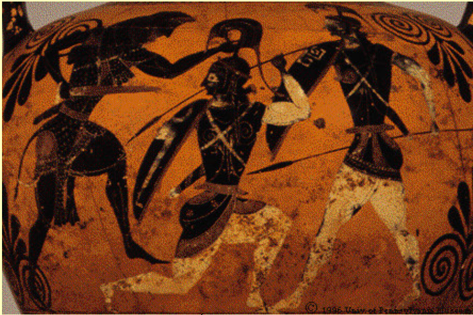
Heracles lucha con dos Amazonas. Anfora ática de figuras negras. Se dice que fue encontrada en Gela, Sicilia. Datada entre el 540 y el 530 a. C.

ingente gloria de este país, tomaron consigo a los más belicosos de entre los pueblos y, con grandes esperanzas de obtener alta reputación, emprendieron una expedición contra esta ciudad; pero, al tropezar con guerreros valerosos,